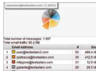
Detaillierte Berichte und Statistiken