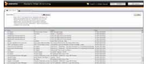
E-Mail-Suche in wenigen Sekunden